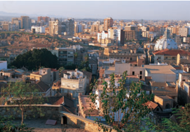
Cartagena fue una de las localidades que logró resistir al avance de las tropas napoleónicas por nuestra región.